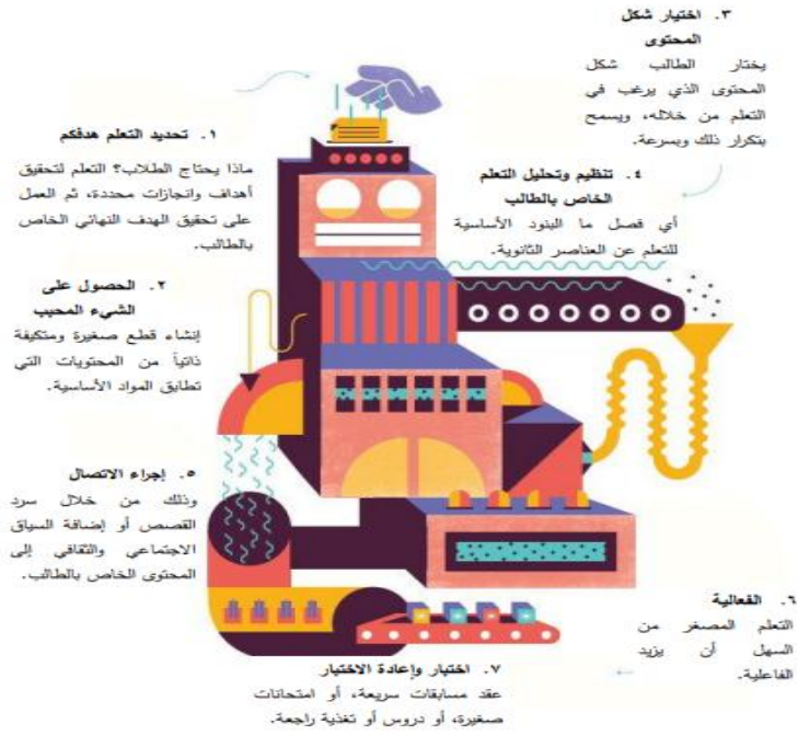
شكل (٢) الخطوات الأساسية للتعلم المصغر التي قدمتها شركة Grovo

وقد أثبت العديد من الدراسات فاعلية البودكاست "Podcast"، في العملية التعليمية حيث قارنت دراسة "Williams & Augustine" (2018) بين تأثير "أودكاست/ فودكاست" على التحصيل الأكاديمي لطلاب المرحلة الجامعية الحاصلين على تكنولوجيا المعلومات والاتصالات في البحث، تم الكشف عن أن الطلاب الذين يدرسون باستخدام podcast إنجازات أكاديمية أعلى من أولئك الذين يدرسون باستخدام vodcast ، وأكدت دراسة Robin (2018) أن مقاطع الفيديو الصوتية (vodcasts) تكتسب شعبية في التعليم الطبي، لكنها يمكن أن تكون وسيلة تعليمية سلبية إذا لم يشارك الطلاب بنشاط مع المحتوى، كما كشفت دراسة "Nauman" (2017) تأثير Audio Podcasting كأداة تعليمية متناهية الصغر، وأكدت أهمية البث الصوتي المقدم إلى الطلاب من الجنسين، وأثبتت فاعلية التعليم المصغر أسلوبًا جديدًا للمساعدة في عملية التعلم في التعليم، وذلك من خلال تقديم محتويات المقرر في أجزاء صغيرة وخطوات صغيرة، كما توصلت دراسة "Patricia." (2014) أن درجات الطلاب في الموضوعات المتعلقة بمحاضرات الفودكاست فاقت درجاتهم