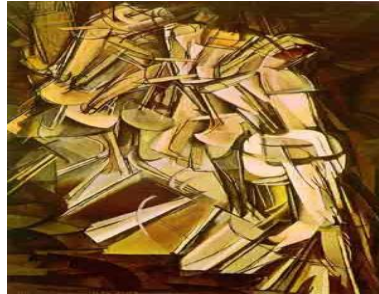
صورة رقم (١)

وقد أبدع دوشامب في احدى لوحاته التي عبرت عن الحركة عارية تنزل الدرج صورة (٢٠) فقد أوجد الزمن من خلال تسلسل الحركة لهذه المرأة وهي تنزل من السلم ، ومن خلال المدخل التحليلي والعرض التجريدي لعناصر العمل الفني ، وهذا المفهوم الفلسفي التصوري يعتبر أهم دعائم المذهب المستقبلي (١).