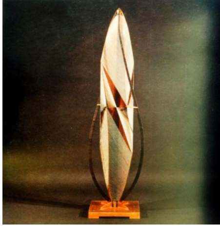
صورة رقم (٥)

تتم الحركة الفعلية الميكانيكية عن طريق القوة الكهربائية (الموتور) كأعمال الفنان البلجيكي " بول بيري Pol Bury " الذى صاغ أعمالاً فنية اعتمدت على وجود محرك كهربائى غير مرئى بحيث يتحرك حركة بطيئة وكذلك نرى أعمال الفنان " ناعوم جابو " الحركية من خلال موتور والتي قامت على فكر المدرسة البنائية بمعناها الواسع والشامل كما فى الصورة (٥) وهو عمل مركب بنائى ثلاثى الأبعاد ١٩٦٢ مثبت على قاعدة ويتحرك من خلال محور رأسى ، ويرى من جميع الجهات ، ويتغير تبعاً لتغير زوايا الرؤية (١) .