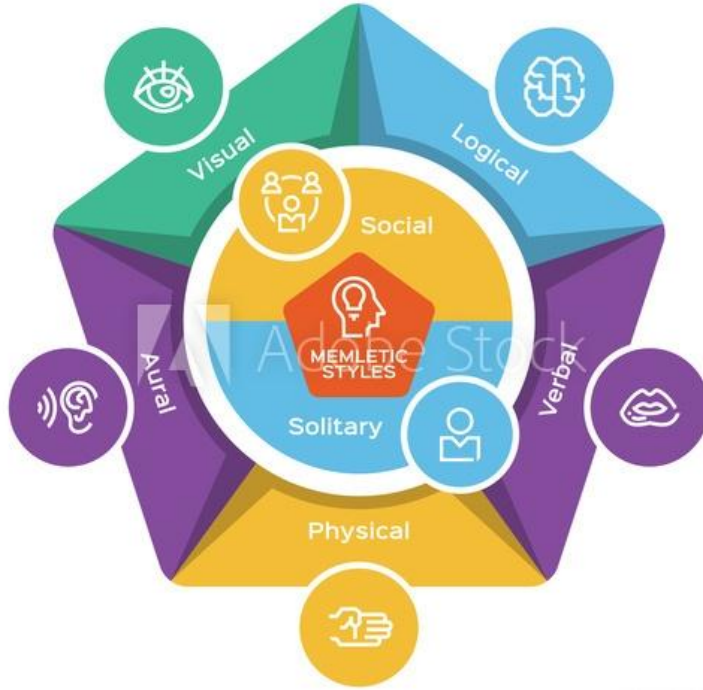
شكل (٢) أساليب التعلم المرتبطة بفصوص المخ وفق النموذج المتكامل للياقة العقلية (ميمليتيكس (Memletics)

ويتضح مما سبق أن أساليب التعلم درست في ضوء توجهين؛ الأول: توجه وصفي تربوي "معرفي" اهتم بدراسة أساليب التعلم في مجال التعليم والتعلم، والثاني: توجه عصبي اهتم بدراسة أساليب التعلم من الزاوية العصبية، وهو محور اهتمام الدراسة الحالية. ولقد انطلقت العديد من الدراسات والبحوث والأدبيات الأجنبية والعربية التي تناولت أساليب التعلم المرتبطة بفصوص المخ (ميمليتيكس Memletics)، منها: ويتيلي (Whiteley, 2004)، وأحمد المطيري (٢٠١١)، والسيد صقر (٢٠١٤)، وكوثر أبو قورة (٢٠١٩)، وسليمان