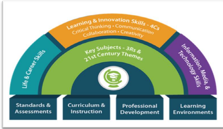
الشكل (٢): مهارات القرن الحادي والعشرين (Painter ship for 21 st century, shrills, 2006)

حثّ الدين الإسلامي على ضرورة امتلاك الفرد لمهارات القرن الحادي والعشرين في القرآن والسنة النبوية، في كثير من المواقف، سواءً بالطريقة المباشرة، أو بالتدريب عليها من خلال المواقف التعليمية، بطريقة غير مباشرة، حيث أن إنّ مهارات القرن الحادي والعشرين تهدف إلى إكساب الأفراد القدرة على التفكير الناقد، وحلّ المشكلات، والابتكار، والإبداع، والاتصال، والتعاون، والتثقيف المعلوماتي، والمرونة، والقابلية للتكيف.