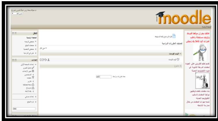
شكل (٧) واجهه التفاعل الأساسية لنظام إدارة المحتوى الإلكتروني Moodle