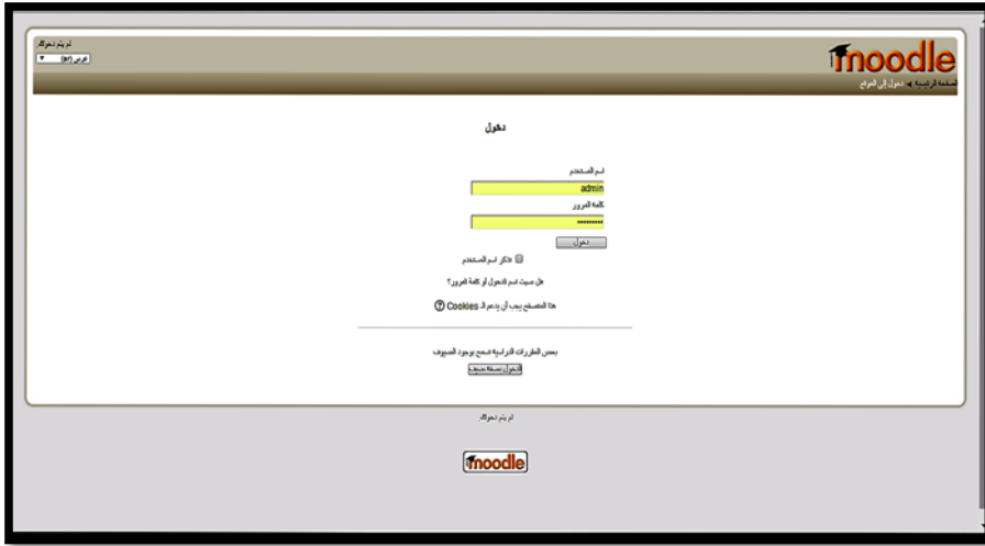
شكل (٨) صفحة الدخول لموقع نظام إدارة المحتوى الإلكتروني Moodle

ويتم الدخول إلى الموقع والمشاركة فيه؛ بعد أن تقوم المتدربة بكتابة اسم مستخدم، وكلمة المرور الخاصة بها التي تم إعطائه من خلال الباحثة لكل متعلمة شكل (٨).